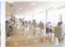
レストラン「R-テラス」