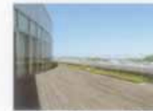
ウッドデッキ(R-テラス屋外)

最上階のレストラン「R-テラス」は、リフレッシュ&リラクスの憩いの空間。一流ホテルの元シェフが提供する料理は、会席風のスマイルランチなど、美しい盛り付けとヘルシーなおいしさが人気です。売店は、クリニック棟とセンター棟の1階に計2カ所、駐車場は約400台分と利便性にも配慮しています。