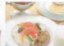
レストランメニュー