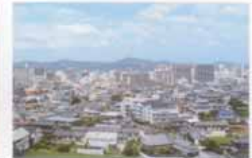
病室から見える風景