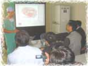
控室にて手術中継画面を元に婦人科医師が説明を行いました。